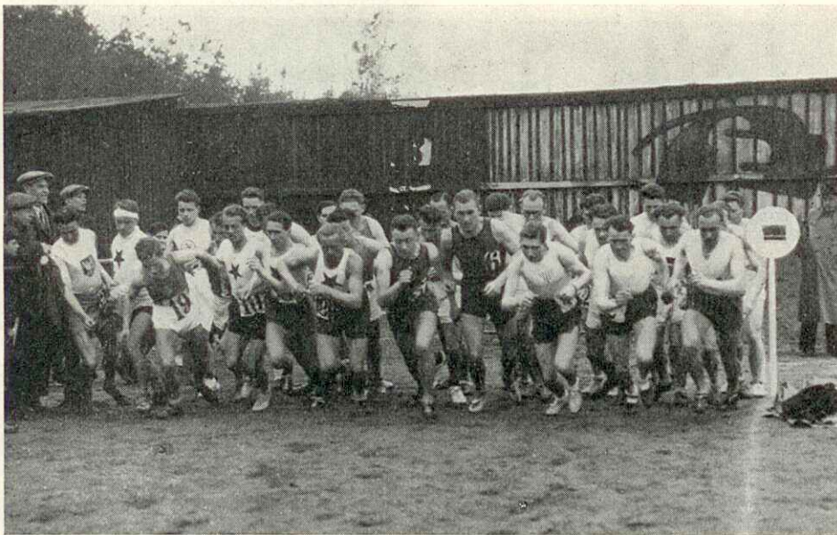
Start k Drozdovu lesnímu běhu

1.500 m se Drozdovi zdařil, avšak čas 4.04.8 min. nemohl být pro malý počet měřičů uznán. Byl by to čas, který značí i dnes světovou třídu.