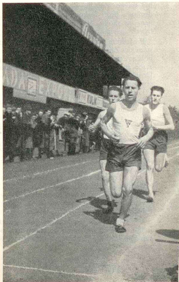
Dorost v běhu na 1000 m