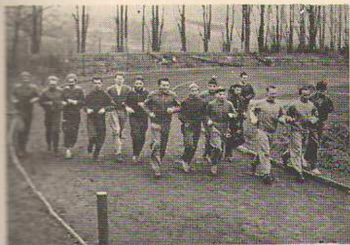
Účastníci „Silvestrovské cross-country“ při rozvířování na dráze před vyběhnutím