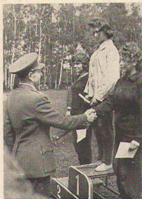
Vítězům okresního přeboru (Běh Mladé fronty) odevzdával diplomy světový rekordman Emil Zátopek