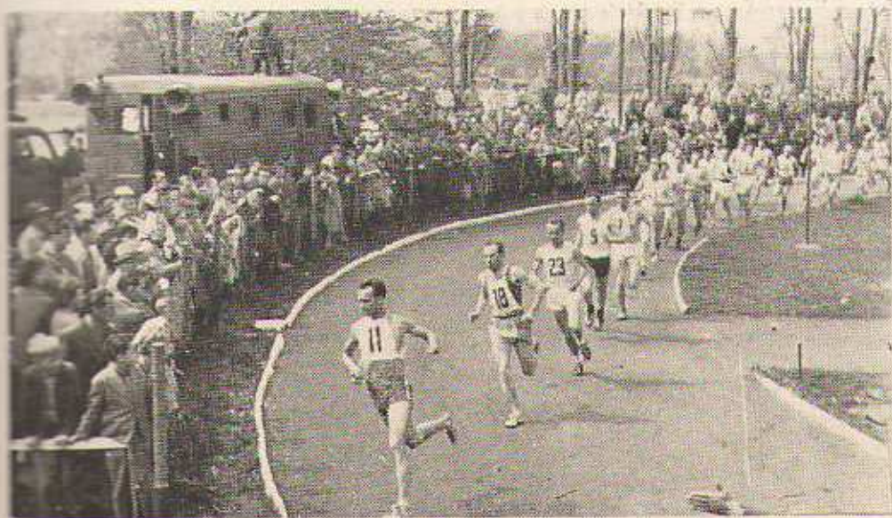
Přebor armády v přespolním běhu byl jedním z největších podniků v roce 1961 pořádaných na našem hřišti