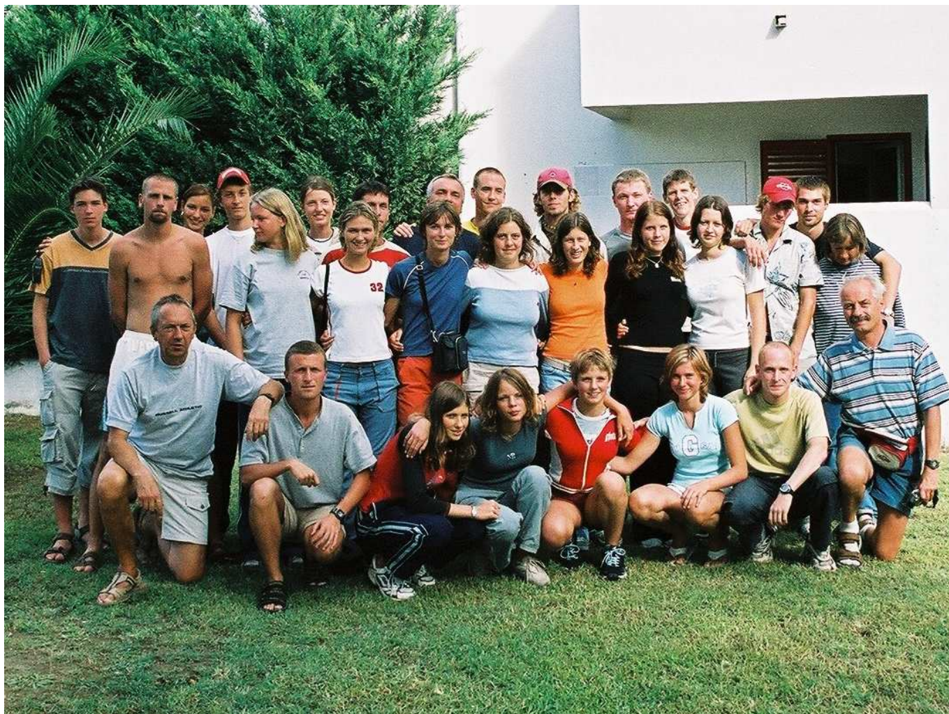
Soustředění v Kalábrii