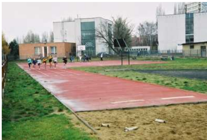
Školní hřiště sportovních tříd